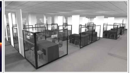
비즈니스 행사장 전경 예시