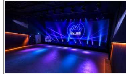
컨퍼런스 전경 예시